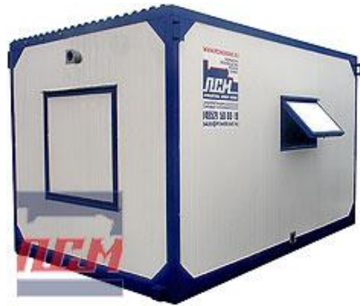
дизельная электростанция в блок контейнере «Север»

Дизель-генераторные установки в зависимости от условий эксплуатации могут быть выполнены в следующих исполнениях: