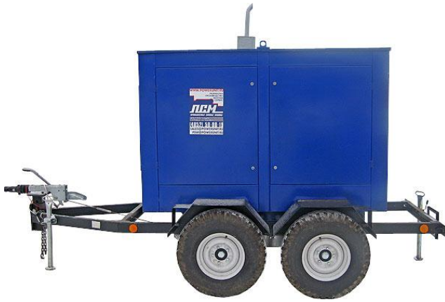
дизель-генератор в погодозащитном капоте на шасси